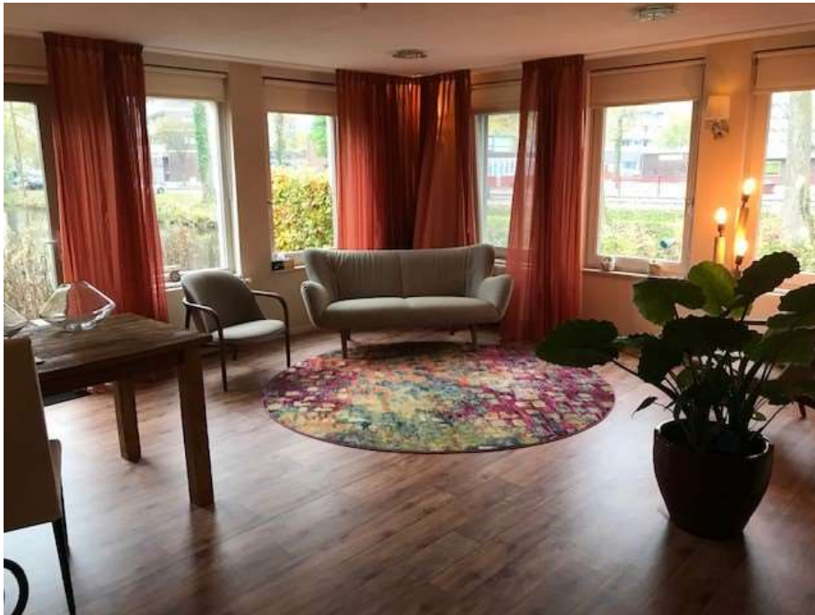
Vernieuwde bezinningsruimte Hospice Alkmaar

Naast de aandacht voor de lichamelijke en psychosociale zorg is er in het hospice ook ruim aandacht voor de spirituele zorg.